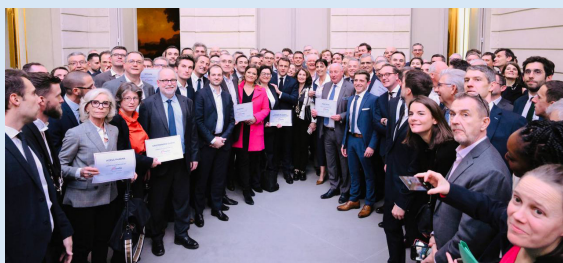
Lancement du programme ETIncelles le 21 novembre 2023 au Palais de l'Élysée.

Le programme ETIncelles au service de la croissance des PME